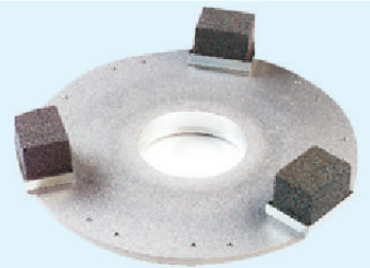
Discos para Pulido de Concreto